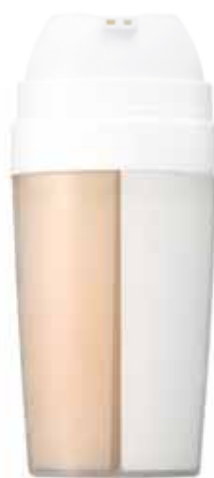
2 槽式ボトル イメージ