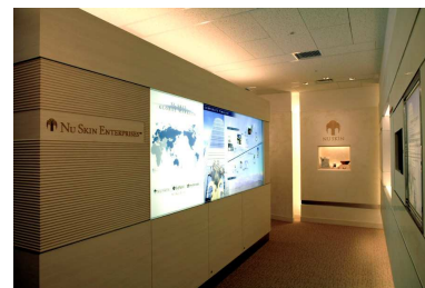
エントランス ギャラリー