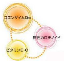
こだわり 1) の相乗効果